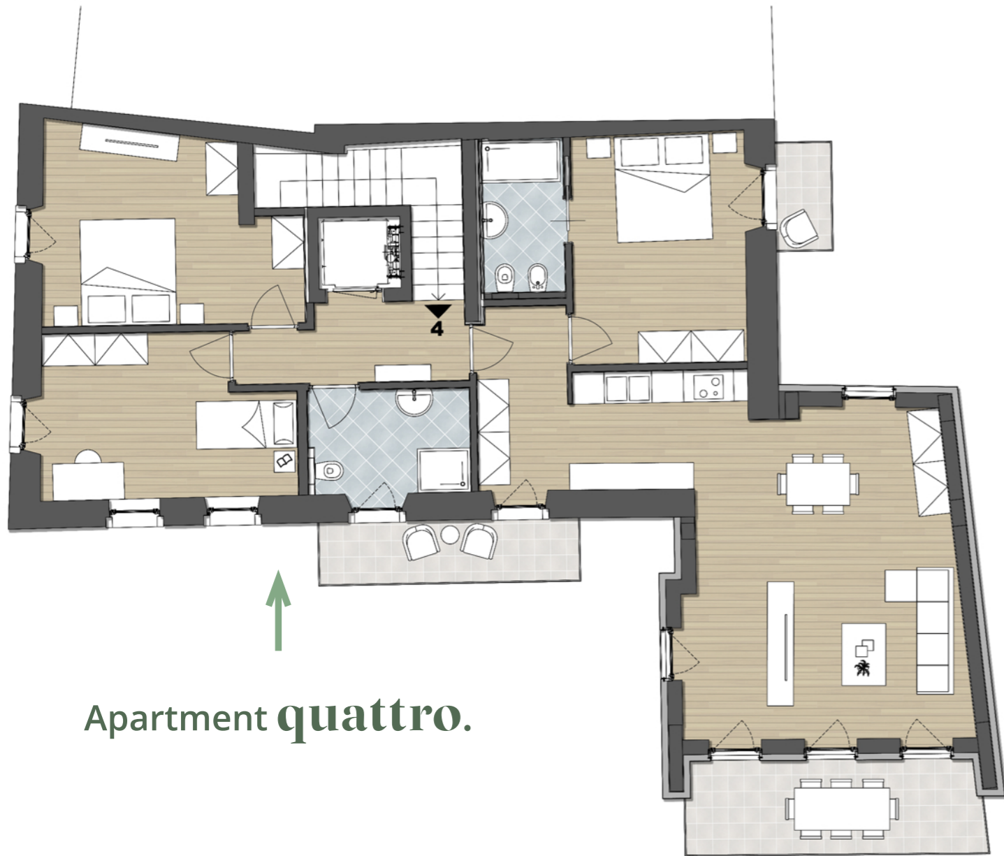
Apartment quattro .